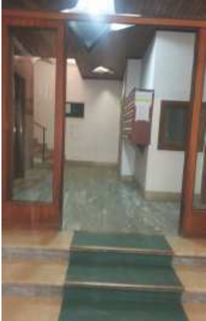
PARTICOLARE INGRESSO INTERNO EDIFICIO DA LARGO LUIGI ANTONELLI, 9 - ROMA